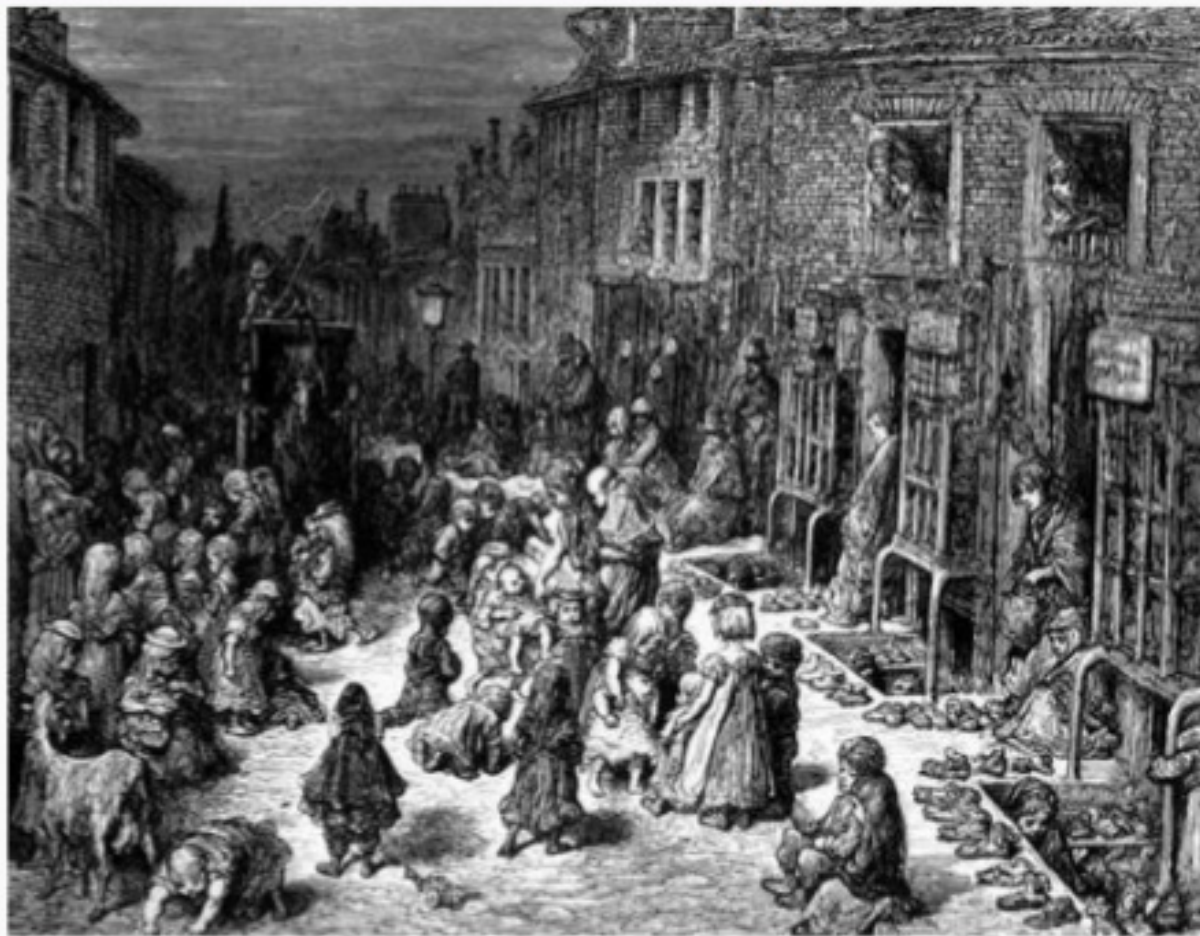
Uma rua de um bairro pobre de Londres (Dudley Street); gravura de Gustave Doré de 1872. (fonte: BENEVOLO, 1999)